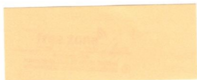
pečiatka a podpis zodpovednej osoby za free-zona s.r.o.