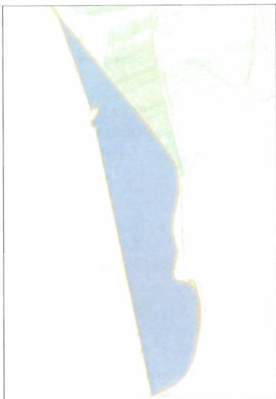
RNS – CKN 2882 k.ú. Malá Domaša