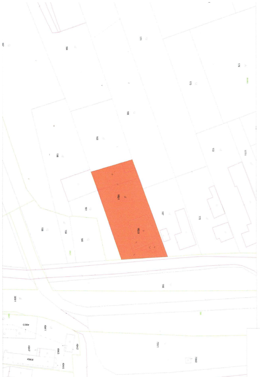
priestor pri budove COOP Jednota