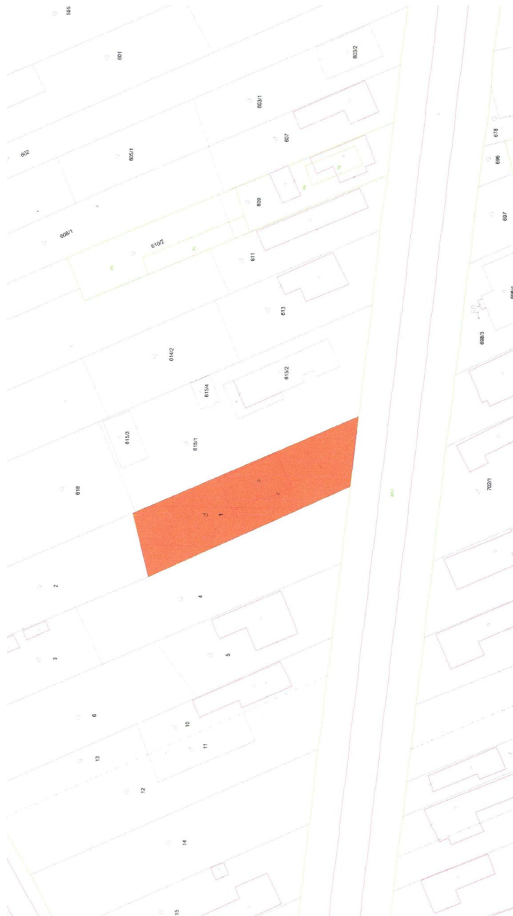
priestor pri budove Obecného úradu obce Horovce